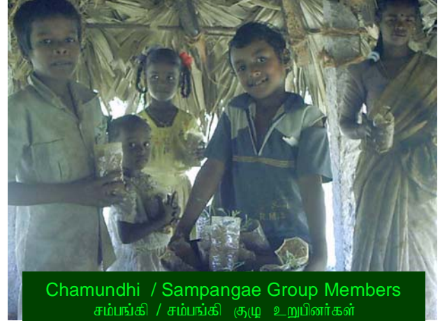
Chamundhi / Sampangae Group Members சம்பங்கி / சம்பங்கி குழு உறுப்பினர்கள்

சித்தூர் கிராமத்தில், சிந்துகவி, காவேரி, சம்பங்கி, மற்றும் சாமந்தி போன்ற சிறு குழுக்கள் கூட்டாக அவர்களின்