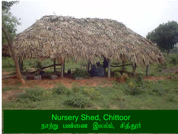
Nursery Shed, Chittoor நாற்று பண்ணை இலலம், சித்தூர்

more than hundreds of intermixture of seedlings for their future needs. Seedlings like, Casuarina, Eucalyptus, Neem, Lemon, Agathai, Drum Stick are conserved under a shed and regular watering, and rich manure is used for healthy growth. One of the small group leaders of this village says that, from now there will not be any causality in the seedlings by direct sun light.