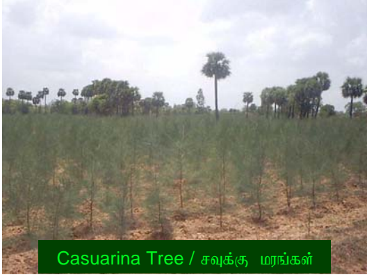
Casuarina Tree / சவுக்கு மரங்கள்

The tree is normally propagated through seeds. The seed is sown usually in November, in well-prepared and manured nursery beds. One hectare of casuarina planted area requires about 1/2 kg seeds for nursery sowing. The nursery beds are made up of light and porous soil mixed with fine manure and ash and levelled. The beds are watered with a fine 'rose' to prevent washing off. They are sprayed with Gamexane or BHC around the beds to prevent caterpillars, mole-crickets and ants from carrying away the seeds. The germination starts in 7-10 days and is complete in about 30 days. Early and complete germination is obtained if the beds are covered with straw or palm-