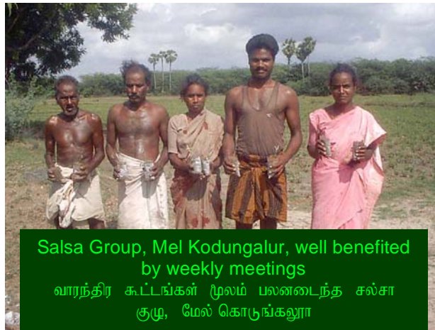
Salsa Group, Mel Kodungalur, well benefited by weekly meetings வாரந்திர கூட்டங்கள் மூலம் பலனடைந்த சல்சா குழு, மேல் கொடங்குலூர்

என்ன செய்கின்றது என்பதை TIST-க்கு தெரியப்படுத்தலாம். எவ்வாறு குழு வளர்ந்துள்ளது என்ன தெரிந்து கொண்டீர்கள் என்பதை மற்ற குழுவுக்கும் தெரிவிக்கலாம். வெறு ஏதேனும் கேள்விகள் இருந்தால் அதை மாதந்திர அறிக்கையில் தெரிவித்தால் இவை அனைத்தும் செழுமை பத்திரிகையில் சேர்க்கப்பட்டு, மற்ற சிறு குழு உறுப்பினர்களுக்கு உங்கள் அனுபவம் நல்ல பலனைத் தரும்.