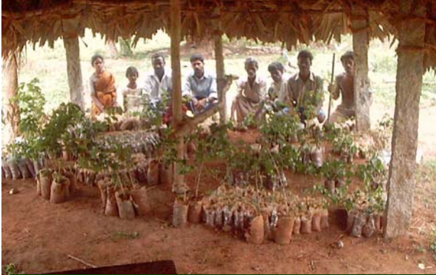
Nursery – Intermixture of Seedlings, Chittoor நாற்று பண்ணை ஊடு கலப்பையினம், சித்தூர்

In Chittoor Village, few Small Groups like, Sindhukavi, Kaveri, Sampangae and Chamundhi have jointly started a Nursery on 23.05.2004 with