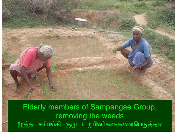
Elderly members of Sampangae Group, removing the weeds மூத்த சம்பங்கி குழு உறுப்பினர்கள்-களையெடுத்தல்

This group was registered as Small Group along with Chamundhi Group on 28.04.2004. The beginning of this group looks to be a real contest with the existing groups. One month after registration, this group now owns more than 10,000 casuarina seedlings. In the end of April 2004, casuarina seeds were sowed and on 23.05.2004 the 3-4 inch shoots were transplanted on the light and porous soil beds of their nursery. These shoots will again be transplanted to a different land with minimum 2 m spacing all sides. Other than casuarina, they are planning to plant fruit bearing trees like mango, pala and goava.