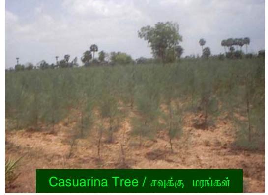
Casuarina Tree / சவுக்கு மரங்கள்

இந்த மரம் சாதாரணமாக விதைகளின் மூலம் பரவும். இந்த விதைகள் எப்போதும் நவம்பர் மாதத்தில், நன்கு பராமரிக்கப்பட்டு உரமிடப்பட்ட நாற்று பண்ணைகளில் விதைக்கப்படும். ஒரு எக்டர் சவுக்கு தோப்பிற்கு 1/2 கிலோ விதைகள் தேவைப்படும், நாற்றுப் பண்ணைகள் குரிய ஒளி படக்கூடியதாகவும், தரமான மண், சாம்பல், உரம் சீராக கலந்து உருவாக்கப்பட்டவையாகும். விதைப்பருகைகள் தண்ணீர் ஊற்றி நன்கு பராமரிக்கப்பட்டிருக்கும். அவைகள் பூச்சி கொல்லி மருந்துகள் தெளிக்கப்பட்டு, வெட்டுக்கிளி, மற்றும் எறும்பு போன்றவைகள் விதைகளை எடுத்துச் சென்றுவிடாத படி பாதுகாக்கப்பட்டிருக்கும். விதைகள் முளைவிடுவது 7 முதல் 10 நாட்களில் தொடங்கி, 30 நாட்களில்