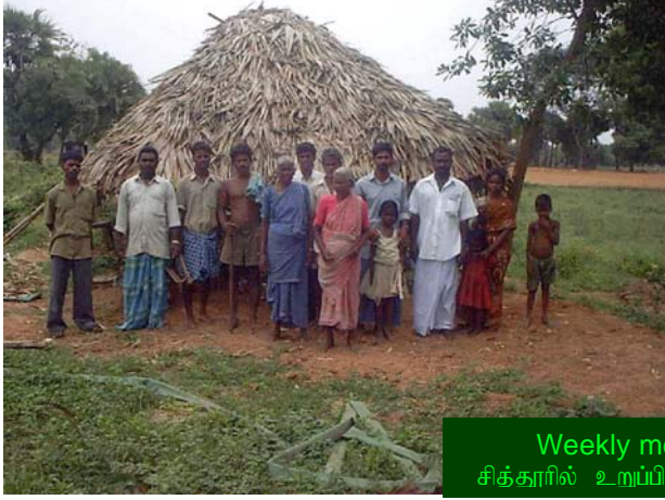
Weekly meetings at Chittoor சித்தூரில் உறுப்பினர்களின் வாரந்திர கூட்டம்

Meeting weekly is one of the best practices for TIST Small Groups. Weekly meetings enable Small Group members to know each other better, to plan, and to help each other grow.