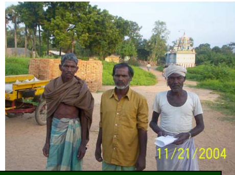
மொளசூரின் புதிய சிறு குழுக்கள்