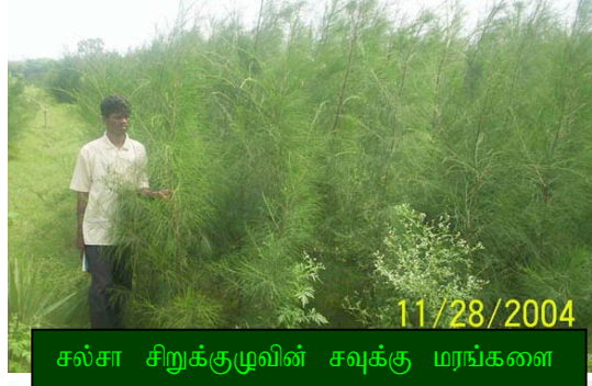
சல்சா சிறுக்குழுவின் சவுக்கு மரங்களை