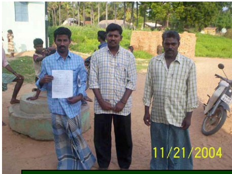
New Small Groups of Molachur