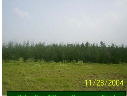
Salsa Small Group Casuarina Field

மரம் நடுவதில் சிறந்த வழி முறைகளைப் பின்பற்றி மற்றக் குழுக்களுக்கு ஒரு முன்னோடியாக இக்குழு திகழ்கிறது. (கடந்த டிசம்பர் முதல் பிப்ரவரி வரை) தங்களின் 4 ஏக்கர் தரிசல் நிலத்தில் பன்னிரண்டாயிரத்திற்கும் (12000) மேற்பட்ட மரங்களை பயிரிட்டுள்ளனர். நாற்பதாயிரம் (40000) சவுக்கு கன்றுகளுடன் பண்ணையையும் ஆரம்பித்தார்கள். அவர்களுடைய கடின உழைப்பு மழையில்லா காலத்திலும்