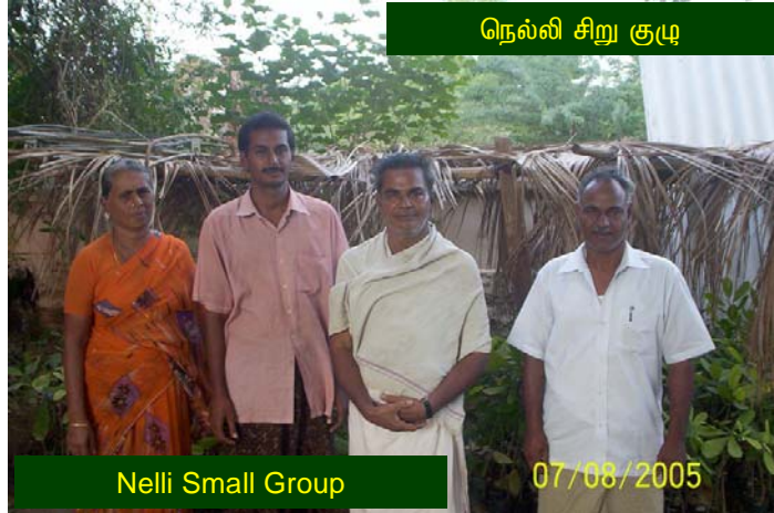
நெல்லி சிறு குழு

Since it was only trees, the members did not show more interest in watering the grove. Suppose, if there had been some intercropping done, then the members would have shown little more interest in watering the grove. The casualties would not have been so drastic. It is always good to do the work in an interesting way, so that work goes smoothly.