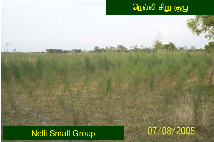
நெல்லி சிறு குழு

There are 10,920 casuarina trees in muthuswamy grove. Five months back during the quantification there were more than 18,000 casuarina trees, but during the last month (August)