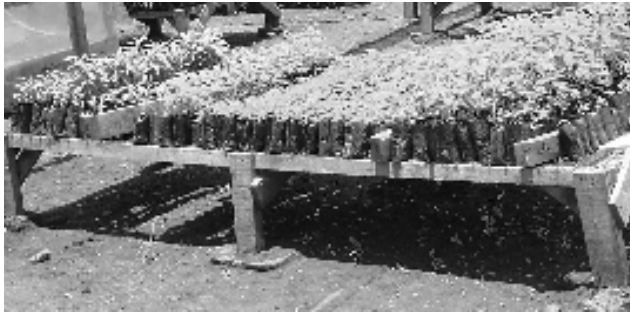
Mbica 2:- Mibuko ya miti ya mithemba mwanya ibangi

Miri niumbaga kugwata inya itigukura kairi. Njira iji mitumaga miri igwata inya na yumba kugwata muthetune na njira imputhu. Kinya ninyiagia ngugi ya kumicaa iria turagirua mono kana ikathithika igita rikuthira na miri ikathuka. Kurimira iriaa rungu rwa antu au ikwithagirwa kinya kuuthi