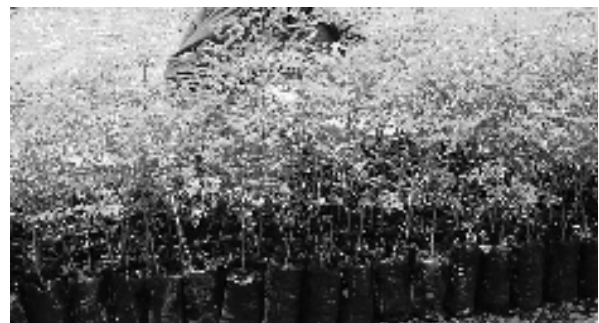
Mbica 1: Miti ya gikundi kia moringa Oleifera ibangi nthiguru.

Mbica 1: Irionarnia njira ya kubanga mibuko ya miti ta uu kwariritue iguru;